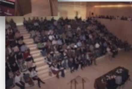
Jornada sobre legislación