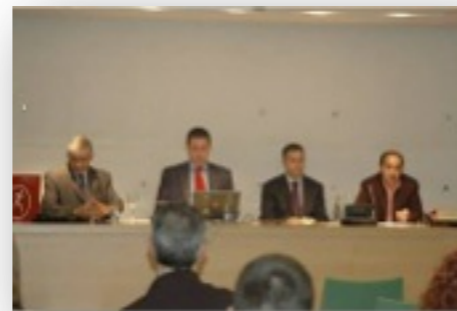
Jornada sobre señalización