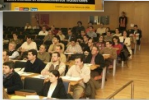
Jornada sobre protección pasiva